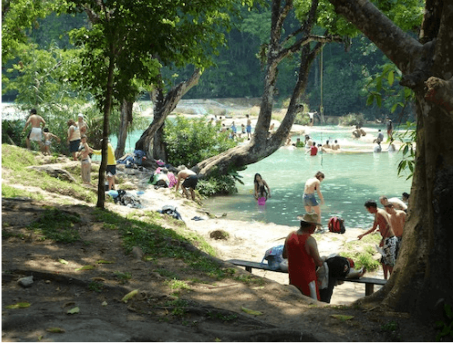
Les Cascades d'Agua Azul, espace-enjeu. Auteur : C. Marie dit Chirot, 2010.

Héritée de plus d'un siècle d'histoire agraire, la situation actuelle au Chiapas est caractérisée par une confusion extrême quant aux régimes juridiques de propriété du sol, situation résumée en ces termes par Daniel Villafuertes : « En un mot, on a généré une situation anarchique quant à la possession de la terre [...] : le droit juridique a perdu son sens, favorisant l'usage de la force comme moyen de pression politique ou de répression » (2002, p. 39) [19] . Dans ce contexte, posséder une terre implique souvent pour les populations rurales du Chiapas (qu'elles soient zapatistes ou non) d'être en mesure de s'organiser pour l'occuper, se l'approprier et, si besoin, la défendre. L'appartenance à une force politique devient un enjeu non réductible à un choix idéologique, enjeu étroitement lié au contexte agraire et matériel local. Face à la crise que traverse le secteur agricole, le tourisme apparaît, pour une partie des populations rurales, comme une alternative à la pauvreté ou à l'immigration. Dès lors, les espaces touristiques deviennent des espaces-enjeux, et les luttes de pouvoir pour leur contrôle semblent contribuer à dessiner une nouvelle géographie des conflits au Chiapas.